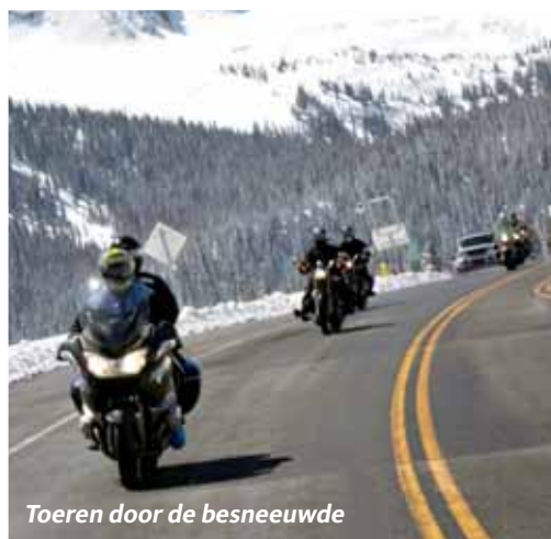
Toeren door de besneeuwde