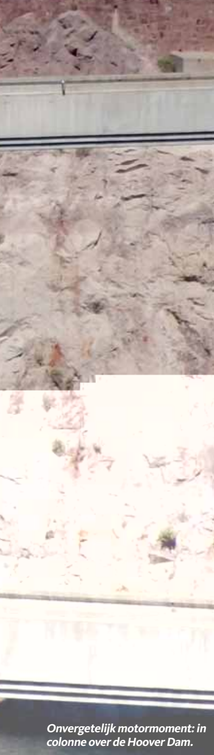
Onvergetelijk motormoment: in colonne over de Hoover Dam.