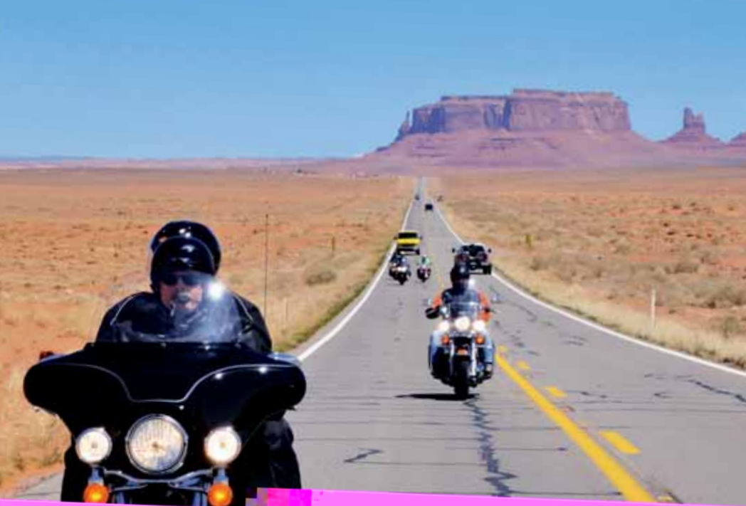
Harleys tegen een monumentaal decor.