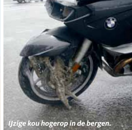
Ijzige kou hogerop in de bergen.